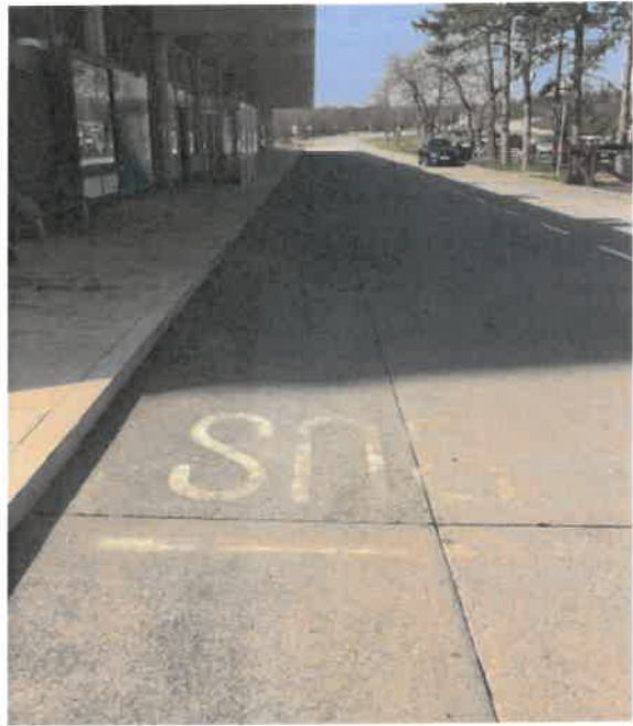
Slika 3. Fotografije stajališta za shuttle i povremeni prijevoz putnika (ukrcajno-iskrcajna zona)