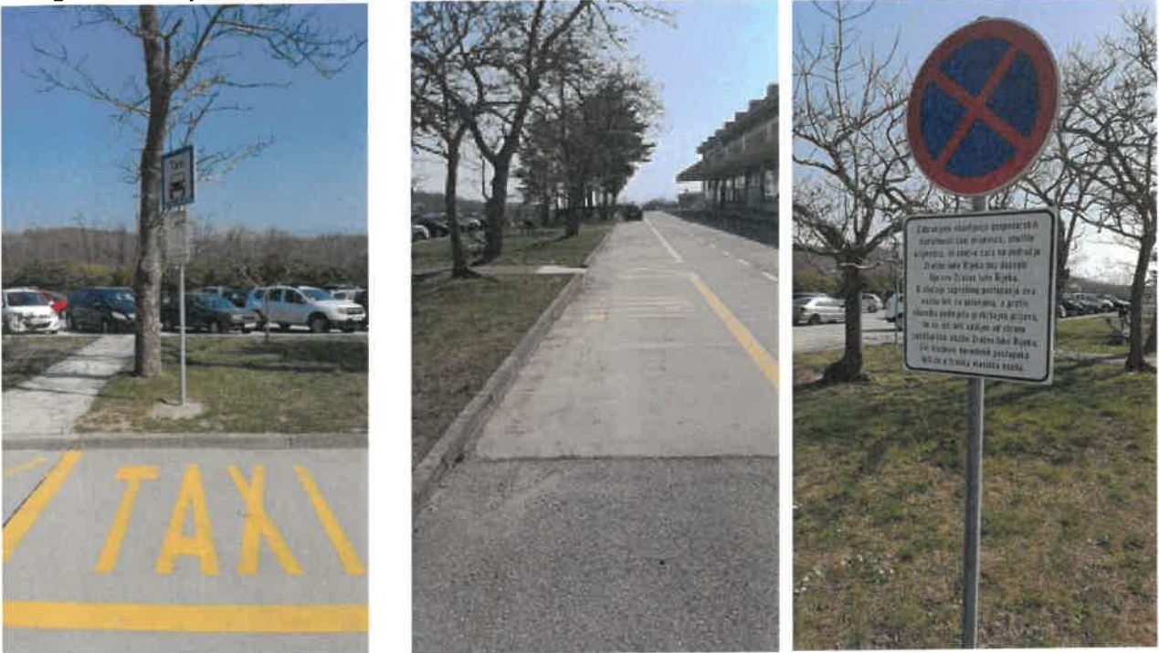
Slika 1. Fotografije stajališta za obavljanje autotaksi prijevoza