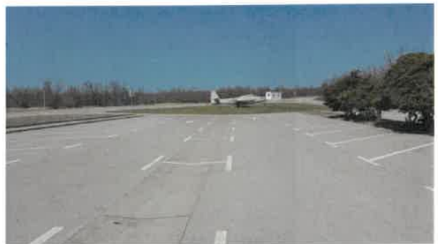
Slika 4. Fotografije parkirališnog prostora za putnike i posjetitelje