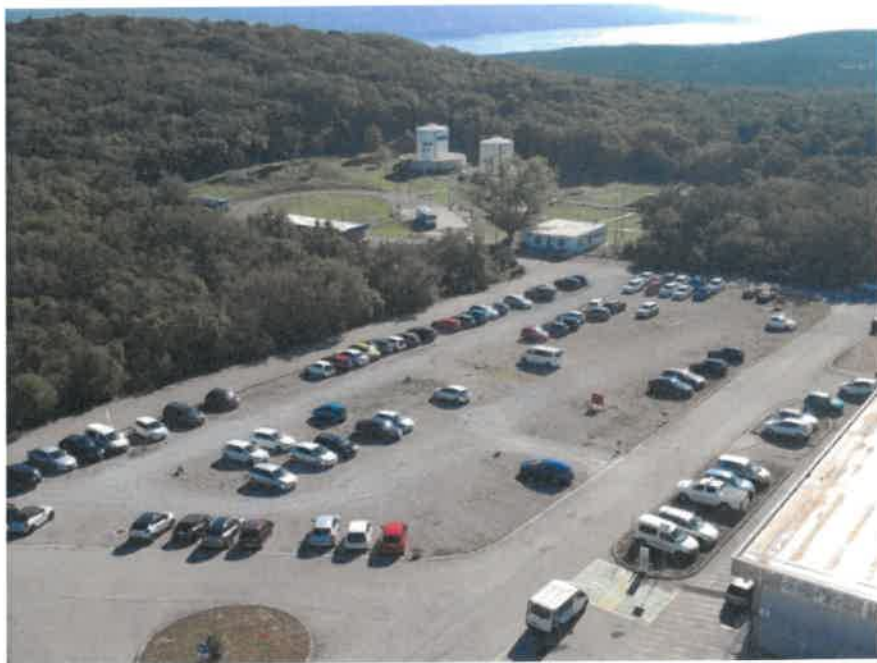
Slika 2. Fotografija parkirališnog prostora za rent a car vozila